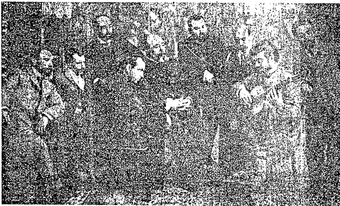
Konzert in seinem Freundeskreis in Valencia / A concert amongst his friends in Valencia Concert parmi ses amis à Valence / Concerto nell' ambiente di suoi amici a Valencia