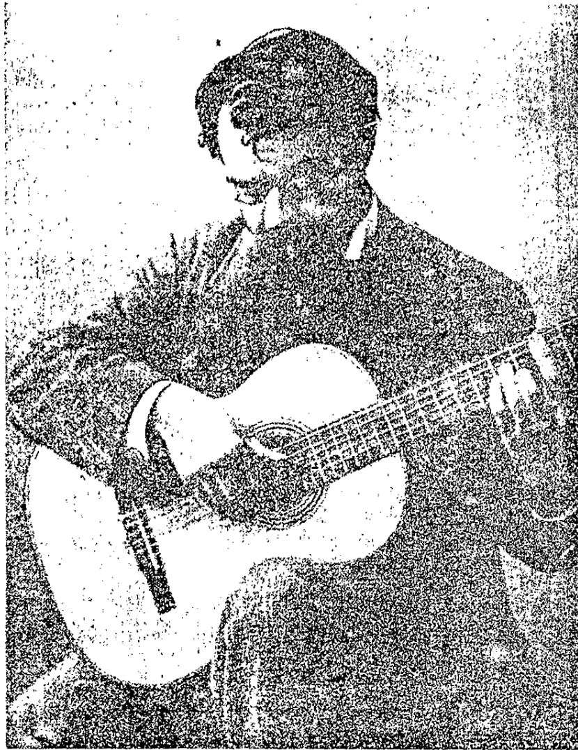
FRANCISCO TÁRREGA, 1852—1909